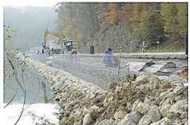
Neubau Geh- und Radweg Waischenfeld-Nankendorf