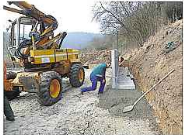
Stützmauer Volleyballfeld Freibad