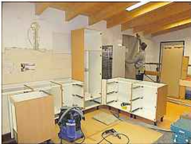
Einbau Küche Sport- und Bürgerhalle