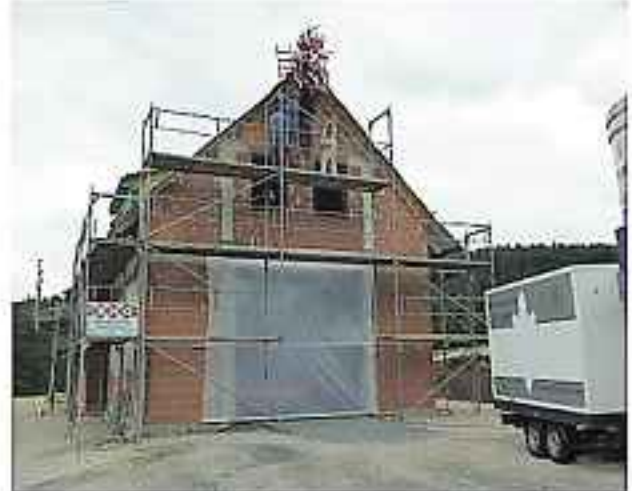
Neubau Feuerwehrhaus Hannberg