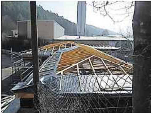
Dacherneuerung Gebäudekomplex Freibad