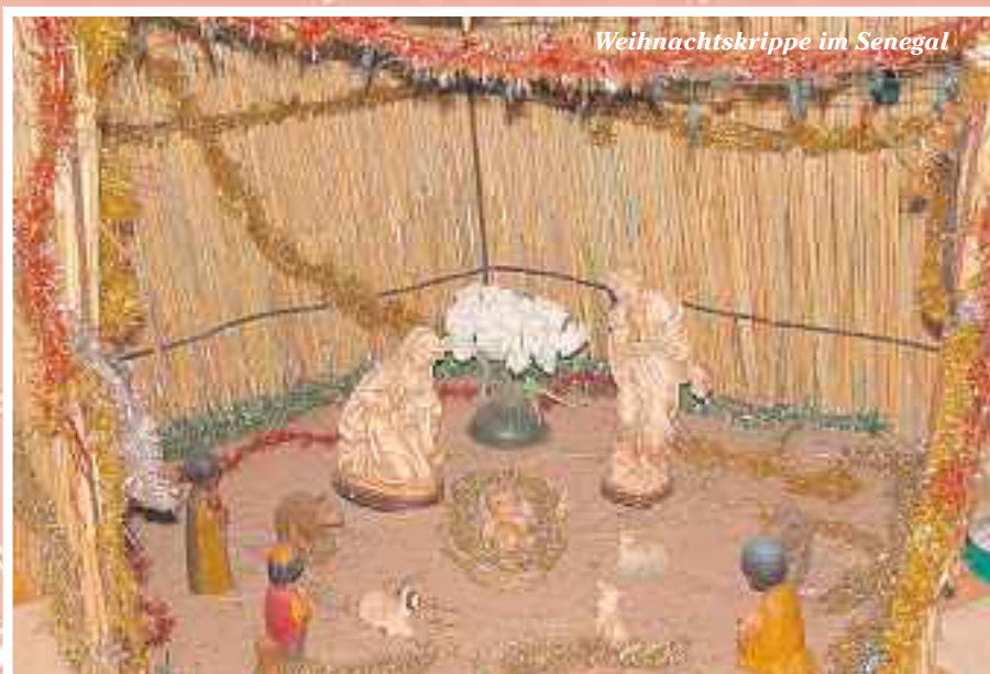
Weihnachtskrippe im Senegal

Sie alle trugen und tragen viel dazu bei, dass es sich bei uns gut leben lässt. Dafür möchte ich Ihnen allen ein herzliches Dankeschön sagen!